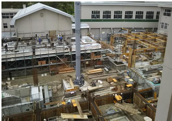
②教室・特別・管理棟建設地